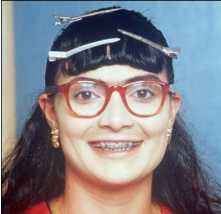
Betty la fea Ugly Betty