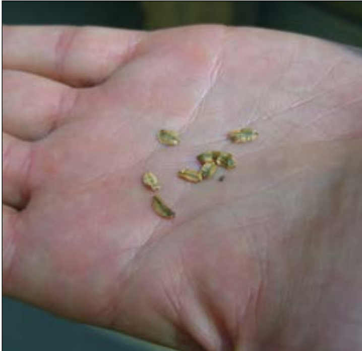
Semillas de Secuoya gigante Giant Sequoia seeds