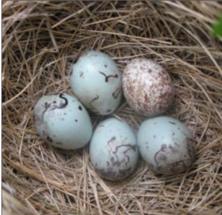
El huevo del Cuco The Cuckoo's Egg