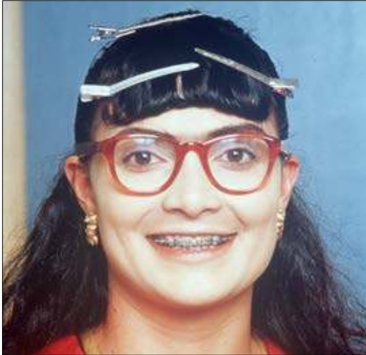
Betty la fea Ugly Betty