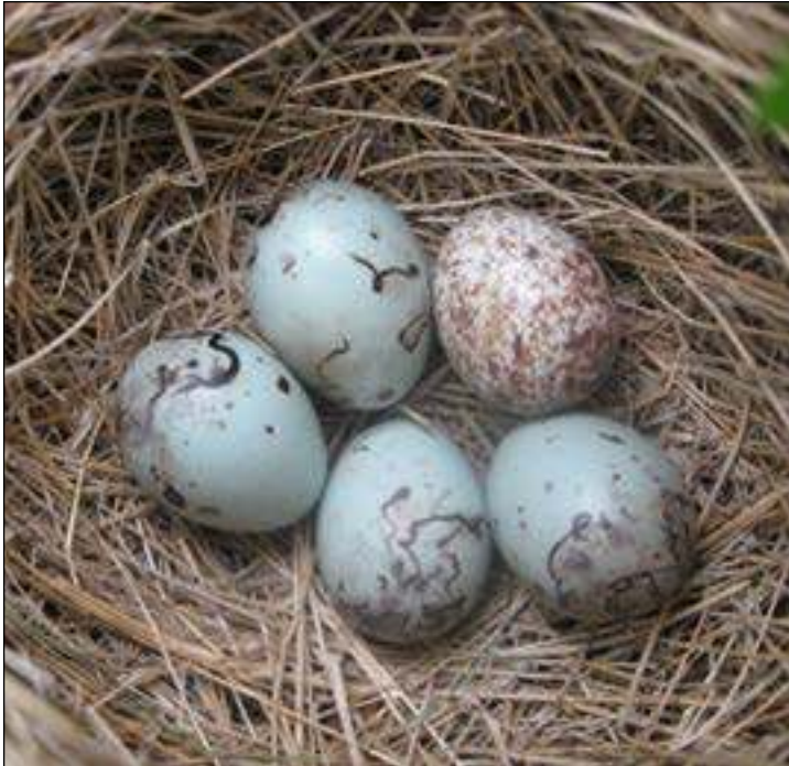
El huevo del Cuco The Cuckoo's Egg