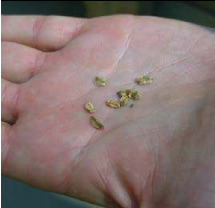
Semillas de Secuoya gigante Giant Sequoia seeds